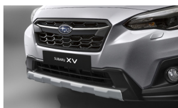
Защитная накладка на передний бампер