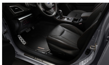
Комплект текстильных ковров