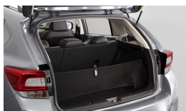
Вертикальная сетка в багажник