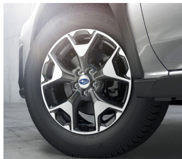
17" легкосплавные диски