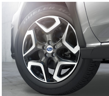
18" легкосплавные диски