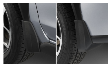
Комплект передних и задних брызговиков